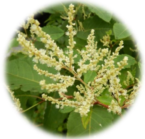
イタドリ 虎杖 別名スイバ、スカンボ (タデ科) 若葉を手でもんで傷口に当てると、血が止まり痛みがとれるとか。”痛みとり”が短縮されて”イタドリ”に。 参考：山溪名前の図鑑 野草の名前