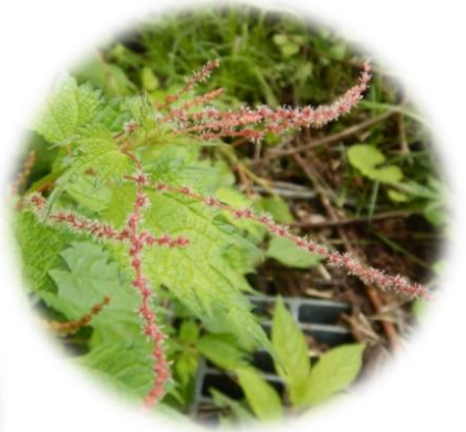
アカソ 赤麻 (イラクサ科) 茎は繊維の材料になる。赤い茎の皮は“麻”に相当するので”赤麻”。アカソの皮を細く裂いて、つなぎ合わせて糸にする。糸にしたら、機織りにかけて布を作る。古い時代から明治時代初期までは、赤麻が繊維材料として役に立っていた。 参考：山溪名前の図鑑 野草の名前