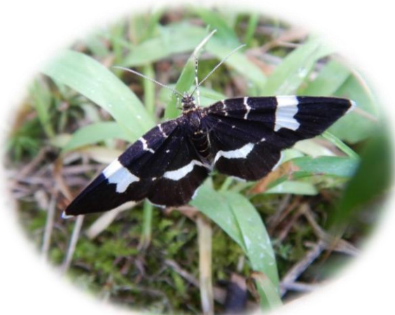
シロオビクロナミシャク (シャクガ科)