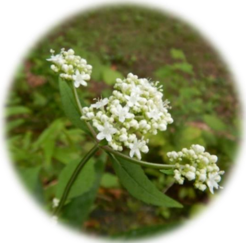
オトコエシ 男郎花 (オミナエシ科)