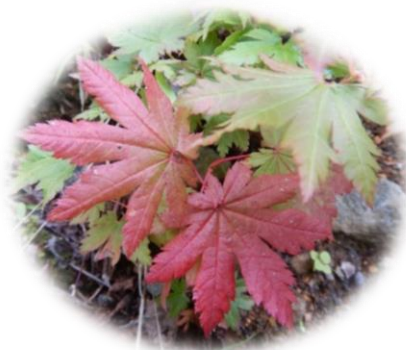
ハウチワカエデ (ムクロジ科)