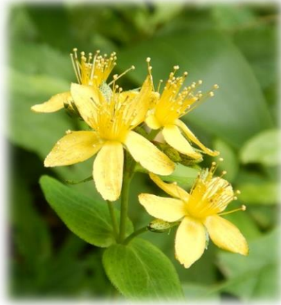
アキノキリンソウ 秋の麒麟草 (バラ科)